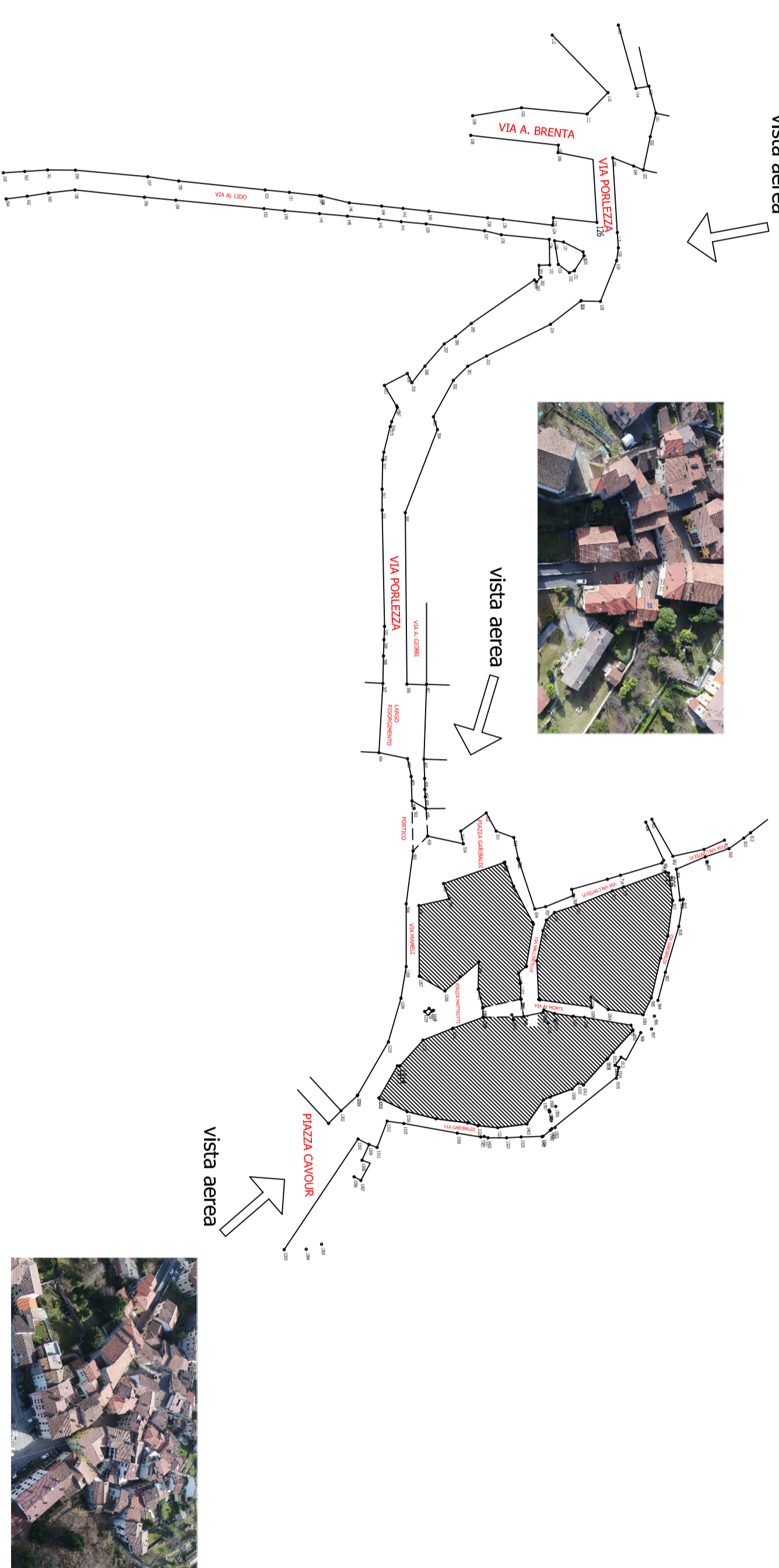
PLANIMETRIA DI RILEVO SCALA 1:1.000